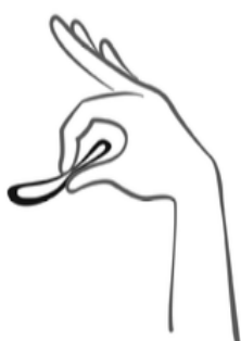
Afbeelding 2 Druk u de ring samen